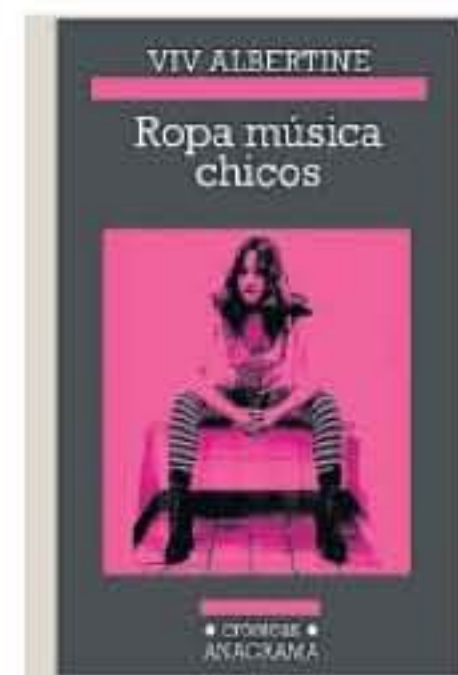
Portada del volumen.

lo más granado de la época, Mick Jones de los Clash, Patti Smith, Sex Pistols, Johnny Thunders que llevaron al delirio y al desfase a aquella tontiloca malcriada, su posterior evolución dejando a sus colegas de gorgoritos, su lucha contra el cáncer, su maternidad, su aborto, su divorcio, su tener que volver del país de las maravillas a la cruda realidad y sobre todo su humor somarda que le permite re-